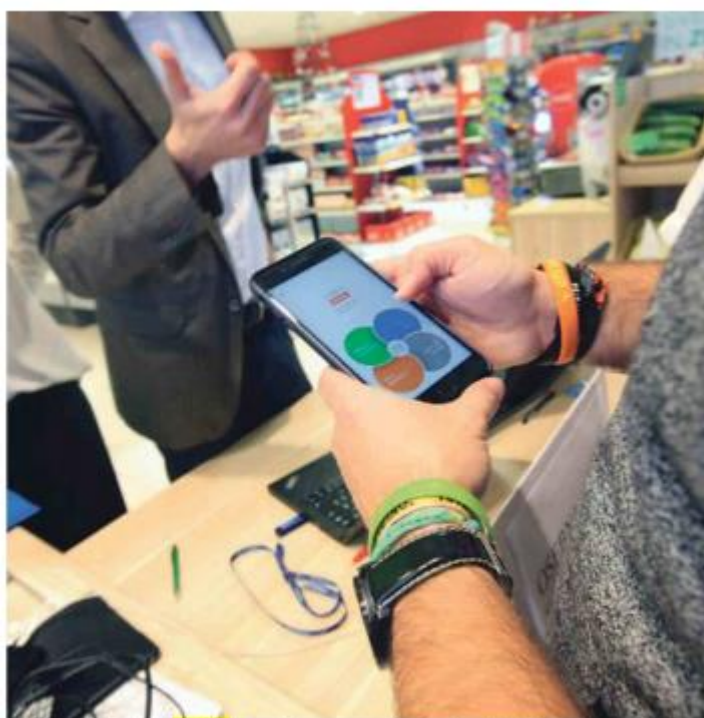
Aplikacijo Petrol mBills povežemo s svojo bančno kartico, s katere lahko polnimo mobilno denarnico.

narnico lahko uporablja vsakdo, ne glede na to, pri kateri banki ima odprt račun, prav tako platforma omogoča, da se vanjo lahko vključijo tudi druga podjetja, trgovci, banke. »Pogovori s posameznimi bankami potekajo,« je potrdil Čadež, dogovor pa bi pomenil, da bi lahko komitenti v Petrolu mBills shranili svojo bančno kartico in tako njeno funkcionalnost prenesli na svoj pametni mobilni telefon.